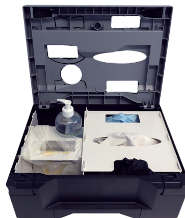
VERSION COUVERCLE AJOURÉ PRODUITS DISPONIBLES SANS CONTACT L.400 X L.300 X H.175MM

* 146 € HT/unité lot de 100 150 € HT/unité lot de 50 - 165 € HT/unité lot de 20 - 195 € HT à l'unité