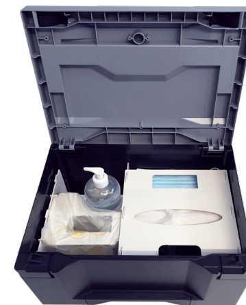
VERSION BOX CLASSIQUE PRODUITS DISPONIBLES EN OUVRANT LE COUVERCLE IDÉAL POUR UN USAGE EN EXTÉRIEUR L.400 X L.300 X H.230MM